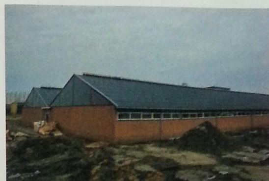
De directe luchtinlaat via de nok en de verwarmingsplaten voor biggen zijn opvallende aspecten van de nieuwe stal.