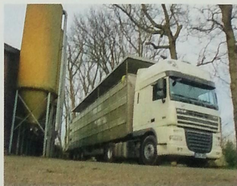
Na eerst 150 zeugen gesloten te houden start Langerwerf nu als subfokker. De Deense gelten zijn zojuist gearriveerd.